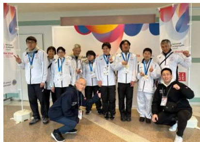
出場アスリート種目と結果