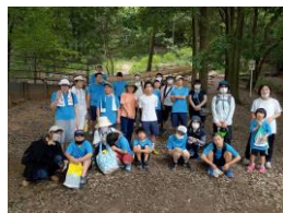
三叢山ハイキング

幅広い年代のアスリートがおり、コーチ、ファミリー、みんなで声を掛け合いながら和やかな雰囲気の中で、みんな頑張っています。 和地・井上