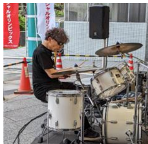
会長の軽快なドラム♪

さて、私たちSON・栃木は、今年で設立20周年を迎えます。そして3月13日付で認定NPOとなることができました。皆様の長年の支えのおかげだと感謝しております。設立20周年の今年は、第8回地区大会を「設立20周年記念地区大会」として開催します。日頃、練習を重ねてきたアスリートの皆さんが、その成果を発揮していただきたいと思えます。