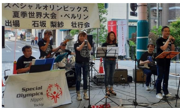
▲宇都宮南ロータリークラブバンドの皆様