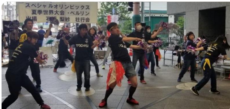
▲SO公式テーマ曲「YOUR SONG」と「手のひらを太陽に」の踊りを初披露する競技チアの皆さん