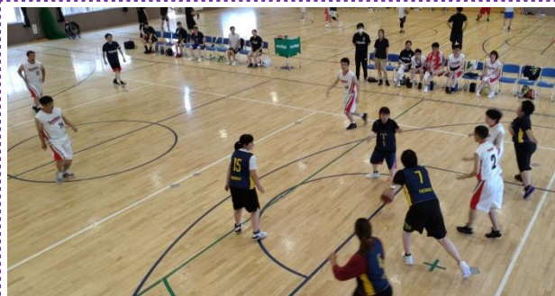
7月2日(土) 青葉学園体育館にて