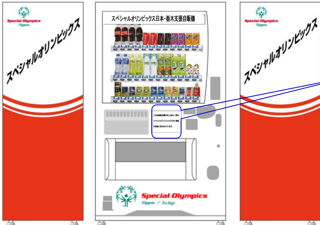
スペシャルオリンピックス日本・栃木支援自販機

この度、スペシャルオリンピックス日本・栃木とコカ・コーライーストジャパン(株)は共同で『SON支援自販機』の展開を始めました。清涼飲料水自動販売機の売上の一部がスペシャルオリンピックス日本・栃木の活動資金となり、知的発達障害のある人たちの自立と社会参加を目指してスポーツ活動・文化活動とさまざまな分野で学びの場を提供して行きます。彼らの夢への挑戦のお手伝いができるばとの思いでご提案させていただきます。